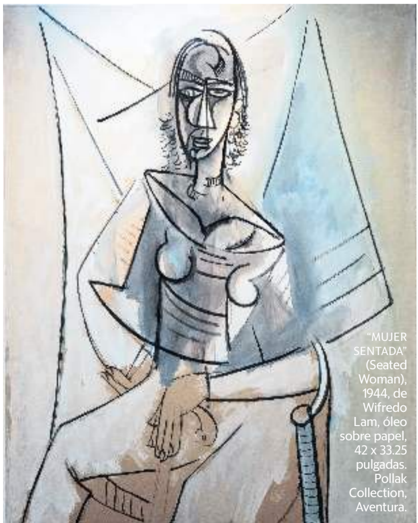
“MUJER SENTADA” (Seated Woman), 1944, de Wifredo Lam, óleo sobre papel, 42 x 33.25 pulgadas. Pollak Collection, Aventura.

De la Fuente ha escrito un libro fundamental para el conocimiento de la relación problemática entre la raza, el racismo y la nación en el espectro histórico y sociocultural cubano contemporáneo: Una nación para todos. Raza, desigualdad y política en Cuba. 1900-2000 , Ed Colibrí, 2001. Pero también, desde hace ya unos años, ha puesto en práctica, desde el punto de vista curatorial, un programa de exposiciones donde despliega algunos de los enunciados contenidos en sus investigaciones sobre este tema, la primera Queloides: Raza y Racismo en el Arte Contemporáneo Cubano , 2010. A esa misma línea de recuperación