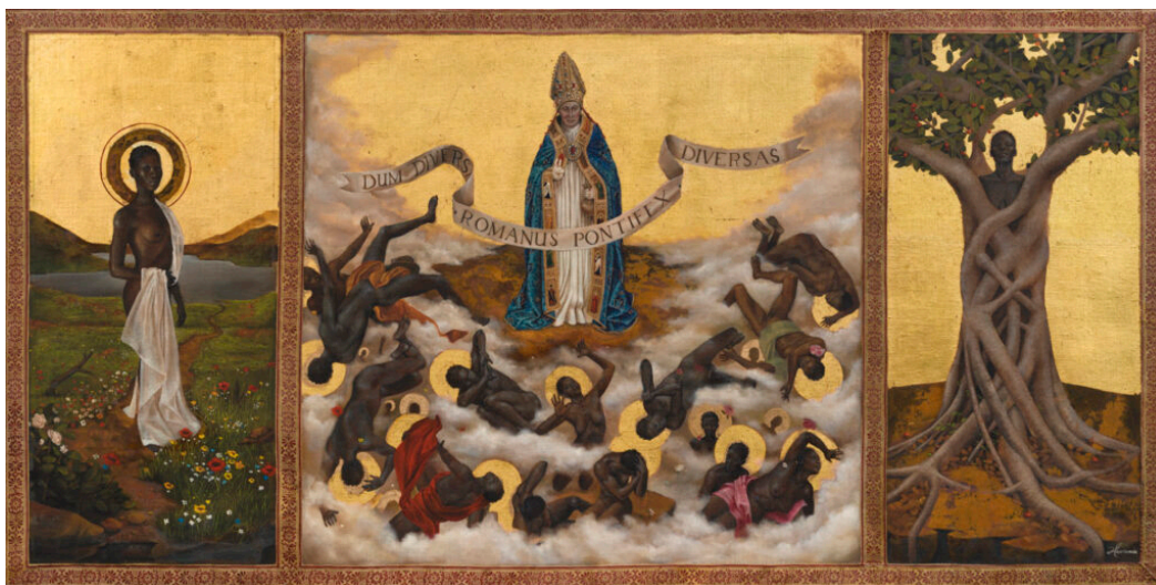
Harmonia Rosales/ Dinis Dias: Land of the Negros (2022)

Sin embargo, ya a finales del siglo XIX existe una comunidad de artistas afrodescendientes que estudia en la Academia de San Fernando en Madrid—no es hasta principios de los años 1900 que los estudiantes afrocubanos pueden cursar estudios en San Alejandro. La Conspiración de la Escalera (1844) causa un estado de consternación que a partir del siglo XVIII tiene una influencia directa en la prohibición de la educación avanzada para africanos y sus descendientes en Cuba. Cabe destacar que Cuba no abole la esclavitud hasta 1886, dato preciso para entender que a principios del siglo XX aún había africanos en Cuba que habían llegado deportados de África por la trata esclavista. Aun después de haber sofocado La Conspiración de la Escalera, la burguesía colonial habanera se mantenía aterrorizada de que los acontecimientos de Haití se repitieran en Cuba.