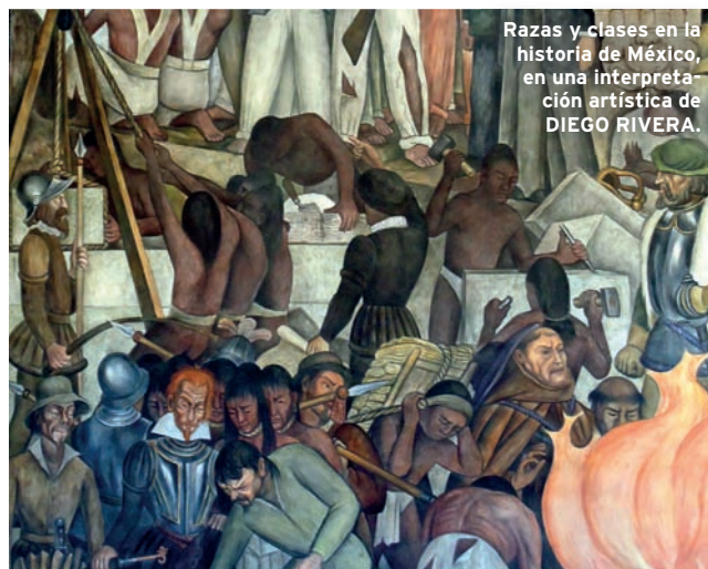
Razas y clases en la historia de México, en una interpretación artística de DIEGO RIVERA.