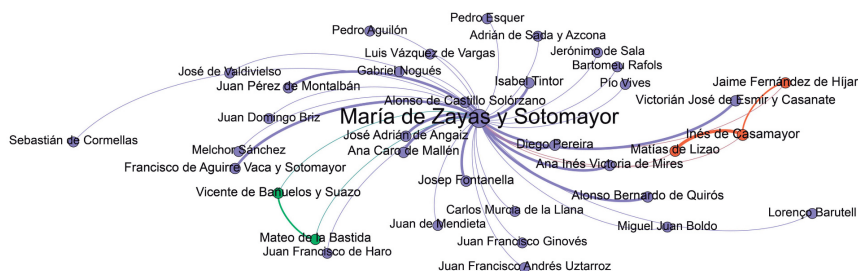
FIGURA 1 Ego Red de María de Zayas. Web de BIESES, https://www.bieses.net/maria-de-zayas-tableau/ , ISSN: 2659-2924

En nuestra propuesta lo que define el vínculo entre los actores es la relación con respecto al libro o escrito de autoría femenina, es decir, atendemos a todas las personas relacionadas con la autora en torno al libro. Forman parte, por tanto, de la red la autora y cualquier persona mencionada en los paratextos de los libros o vinculada de alguna forma a la actividad de la escritura. La red muestra y analiza a los actores por su posición dentro del tejido de vínculos, de ahí que sea esencial identificar la relación que define ese vínculo. Consideramos, entonces, que cada persona mencionada en un paratexto constituye un nodo que, al menos a través del objeto libro impreso, se relaciona con su autora, por lo que cada nodo generaría al menos un vínculo con la escritora. Los tipos de relaciones que hemos identificado tienen que ver con formas de ayuda a la escritura, formas de obstaculización, la intensidad de las relaciones o la duración de estas en el tiempo. Los tipos de relaciones más básicas proceden del vínculo de los sujetos a través del objeto